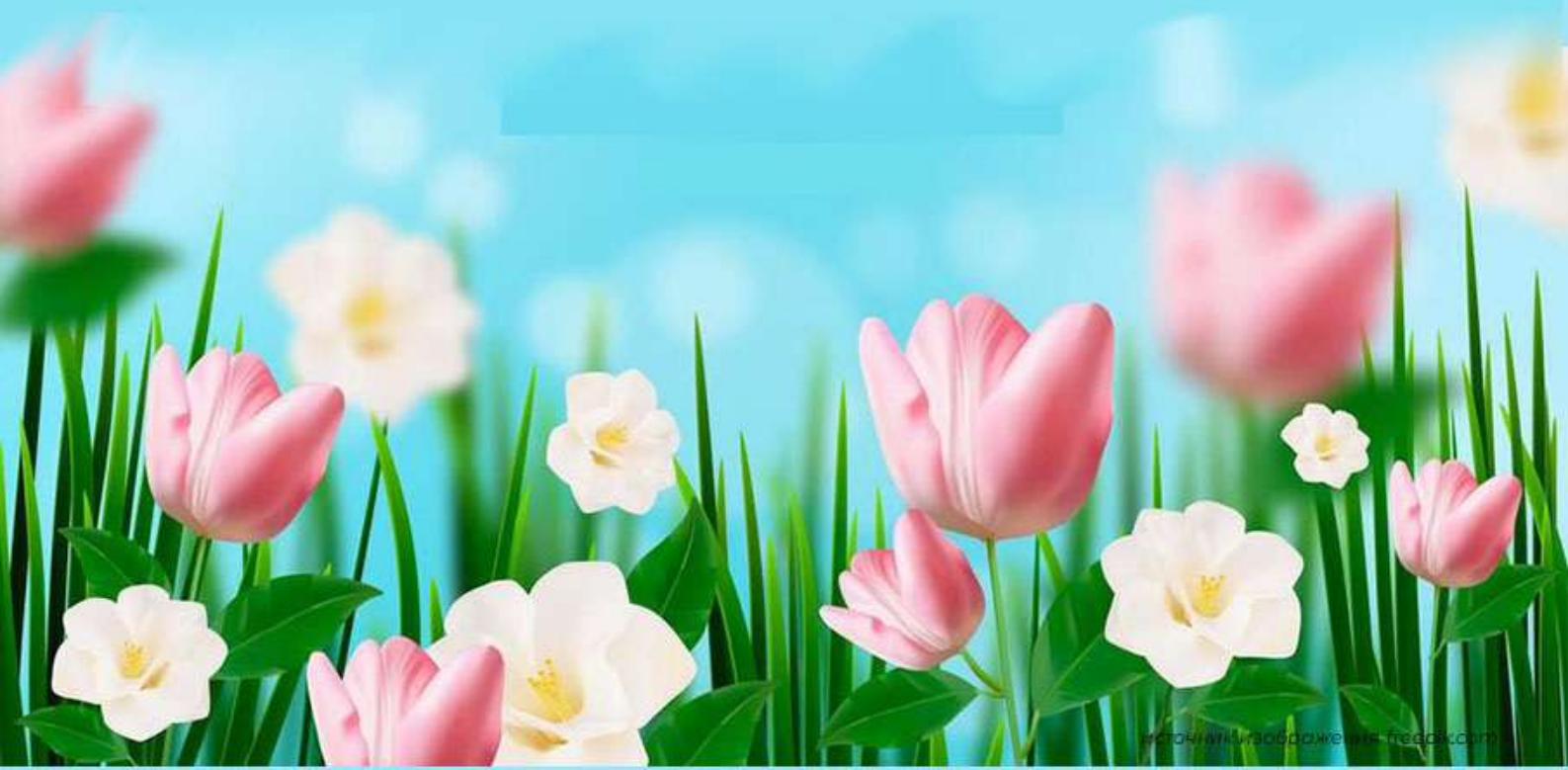
ГРАФИК ВЫПЛАТ пенсий и пособий Отделением СФР по Курской области В МАРТЕ